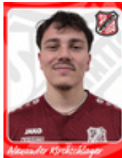
Alexander Kirchsclager Alexander Kirchsclager